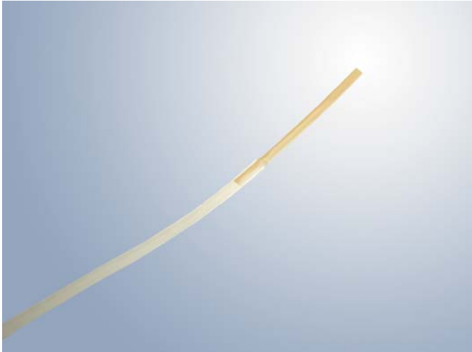
생명 과학용 고정밀 GaAs 기반 광섬유 온도 센서